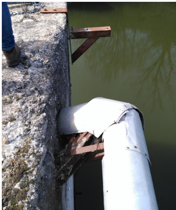
Figura 2.- Detalle de la tubería embebida en el hormigón del azud

A partir de este punto, la tubería se sitúa en zanja hasta llegar al depósito de La Corta.