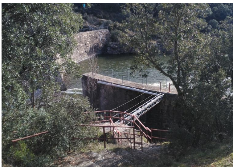
Figura 1.- Paso de la tubería sobre el canal de descarga

La primera parte del trazado discurre en zanja desde la arqueta de válvulas hasta la margen del cauce del río, donde sale a la superficie y cruza el canal de descarga mediante una estructura auxiliar metálica en celosía, siguiendo su recorrido colgada por el lateral del azud como se muestra en la imagen.